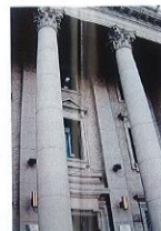
日韓銀行(大連支店) (現大連工商銀行中山広場支店) 外壁・柱頭装飾は当時のまま保存されている。