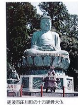
富山県田川町の十万華嚴大仏