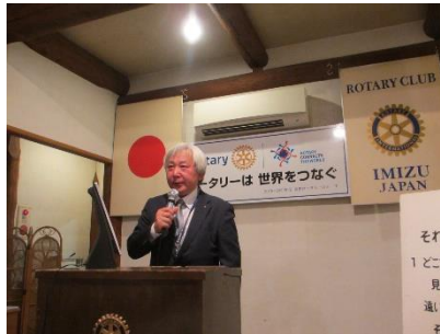
東国際奉仕委員長