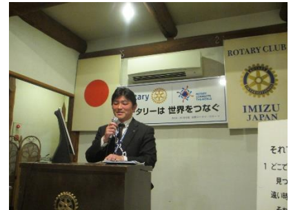
大垣出席・ニコニコBOX委員長